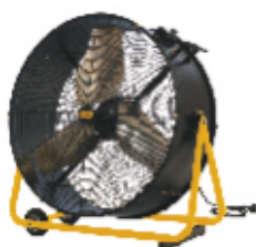
DF 30 P DF 36 P

Tyto profesionální ventilátory nabízí robustní konstrukci, nastavitelný proud vzduchu, otáčení 360 stupňů a model DF20P nabízí rotaci 360 stupňů horizontálně i vertikálně. Model DF20P můžete pověsit na zeď nebo na strop. Oba modely mají specifický směr proudění vzduchu a najdou využití v různých provozech. Zlepšují proudění a cirkulaci vzduchu.