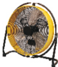
DF 20 P