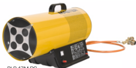
BLP 17M DC

Tato plynová topidla s ručním piezo zapalováním umožňují provoz topidla zcela nezávisle na napájecí elektrické síti po dobu delší než 8 hodin. Lithiovou 3 Ah / 14,4 V baterii lze od topidla snadno odpojit a dobít. Provoz je možný i standardní cestou pomocí elektrického síťového adaptéru. Baterie je kompatibilní s akku BOSCH 14,4V příslušné řady.